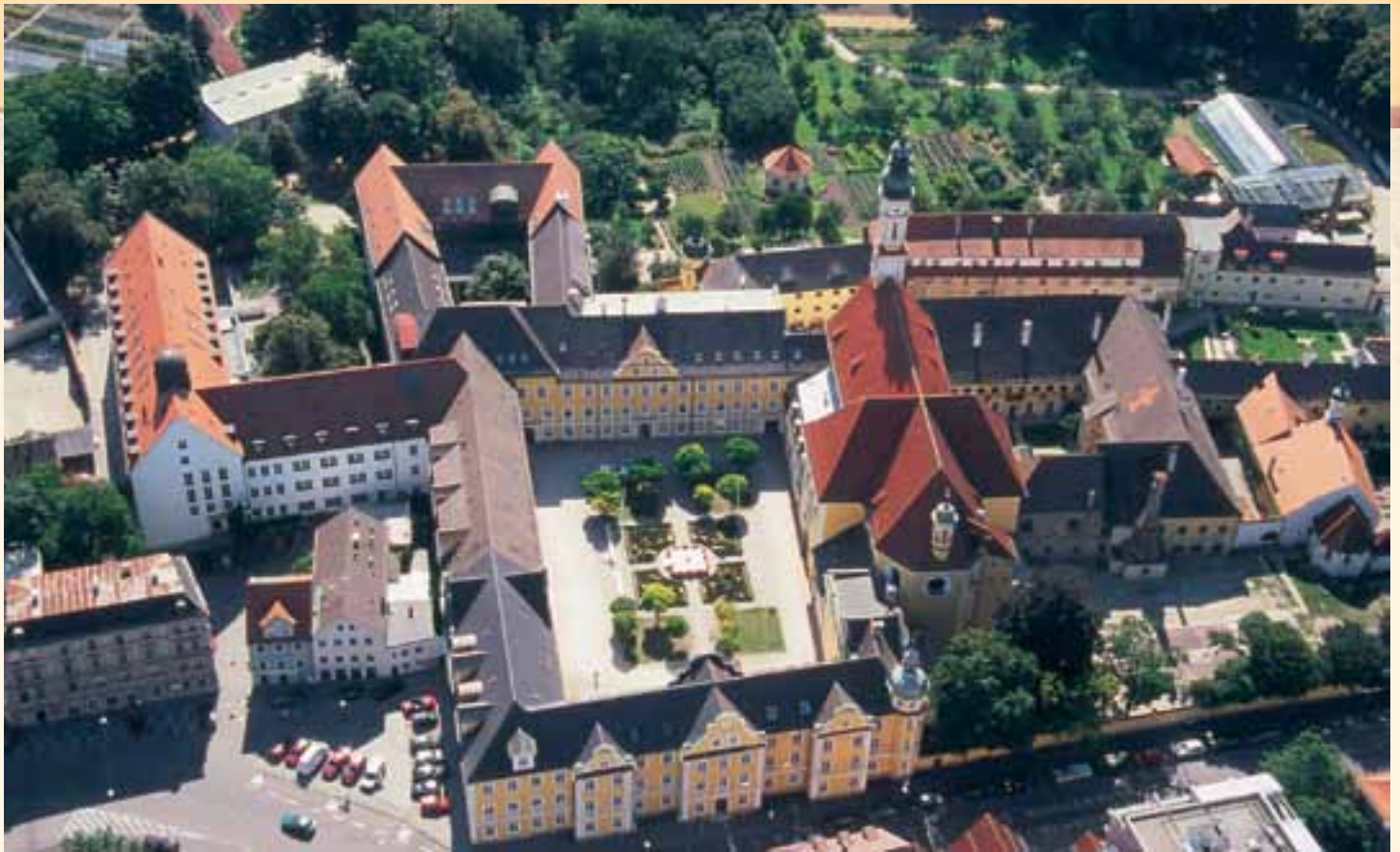
Gesamtanlage vor der Generalsanierung

gut durchdachter Lebensbereich kann dazu verhelfen, sich mehr und mehr auf das Wesentliche zu konzentrieren, sondern auch das Zusammenleben mit Gleichgesinnten trägt dazu bei. Die Wendung nach innen, der Blick auf Gott, die Vermeidung von immer wieder wechselnder Ablenkung und Zerstreuung und die gleichzeitige behutsame Öffnung nach außen, helfen uns, unser selbst mehr und mehr bewusst und so frei zu werden für den Anruf Gottes. Gleichzeitig bringen z. B. bei uns in Seligenthal das klösterliche Leben mit seinem festen Tagesablauf und das Wirken in unseren Schulen und Bildungseinrichtungen uns in ein immer wieder neu zu bewältigendes Spannungsfeld. Hier wiederum helfen die abgegrenzten Räumlichkeiten, als Rückzugsmöglichkeiten mit ihrer schlichten Schönheit die Mitte zu finden zwischen Einsamkeit und Begegnung, zwischen dem Einzelnen und der Gemeinschaft, zwischen der Hinwendung zu Gott durch das Gebet und der Erfüllung der pädagogischen oder anderer Aufgaben, die es zu erledigen gilt. Die Ausgewogenheit unserer schö-