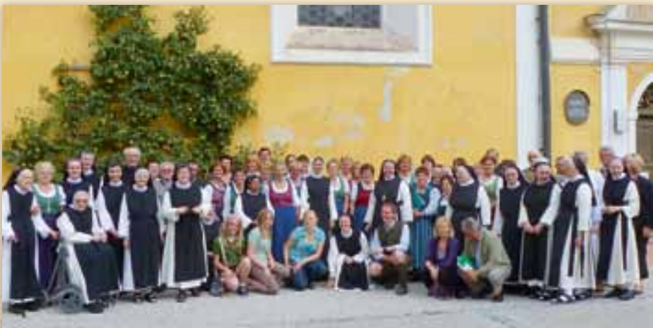
Der Volksliedchor präsentiert sich nochmal im Klosterhof