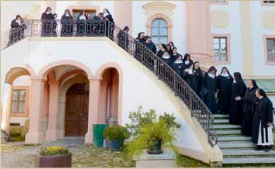
Versammlung auf der Treppe des Ehrenhofes in Marienthal

Waldsassen teil und kurz darauf vom 10. – 15. Oktober an der Vollversammlung der deutschsprachigen benediktinischen Ordensoberinnen in der Abtei Marienthal. Beide Zusammenkünfte, obwohl sie sehr unterschiedlich waren, bereicherten alle Teilnehmer/innen durch die vorgegebenen Tagungspunkte ebenso wie durch die persönlichen Gespräche und Begegnungen. Impulse und Anregungen durch außenstehende Fachkräfte erleichterten die Entscheidungen des Kapitels und die Konfrontation mit prophetischen Texten, die Mut machten, bildeten den positiven Hintergrund für die Überlegungen der Äbtissinnen und Priorinnen der deutschsprachigen Benediktinerklöster