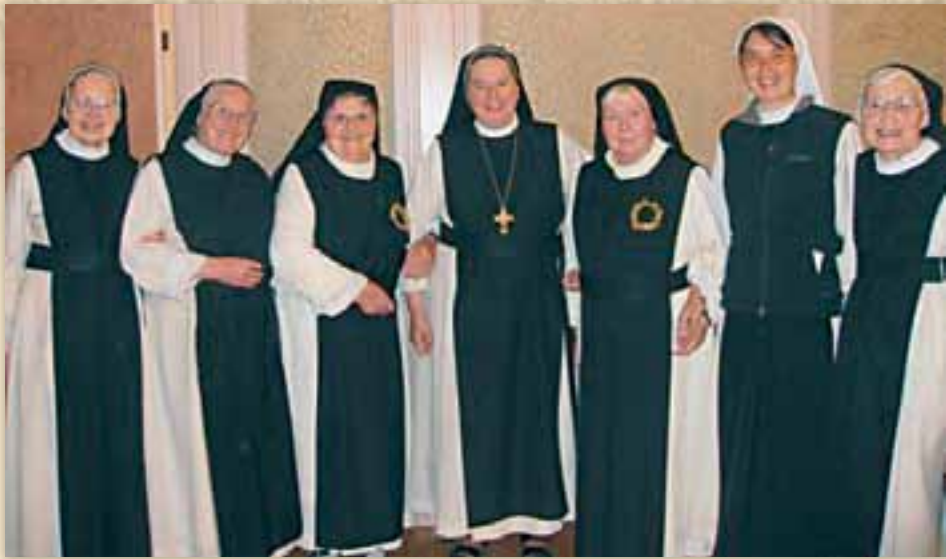
Die zwei Jubilarinnen aus Marienkron