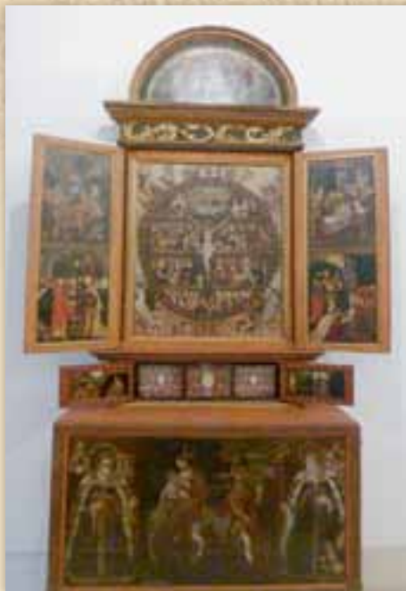
Altar in St. Agatha

Bei der Mitgliederversammlung am 18. September konnten die Freunde Seligenthals die beiden fertig restaurierten Altäre und den gerade bearbeiteten anschauen. So fiel ihnen auch der Beschluss leicht, solange die Mittel reichen, weitere Objekte restaurieren zu lassen. Wir sind dem Freundeskreis sehr, sehr dankbar für die Unterstützung und hoffen, dass immer mehr unserem Freundeskreis beitreten.