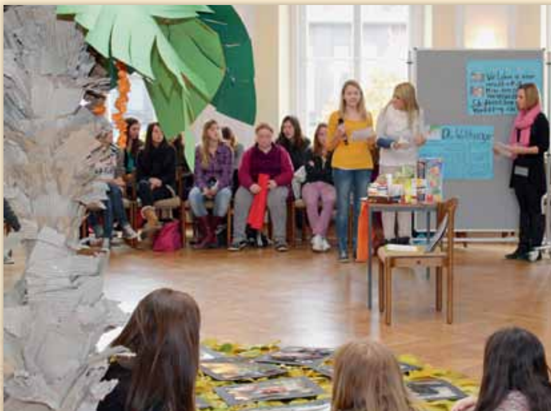
Ergebnispräsentationen des 1. Umwelttages der Wirtschaftsschule