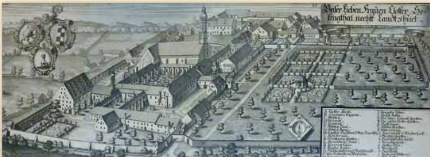
Stich von Wening

Die Kapelle im Untergeschoss des Turmes wurde im Jahr 1602 geweiht. Zu diesem Zeitpunkt wurde auch der Durchgang im Turm nach „St. Agatha“ vermauert.