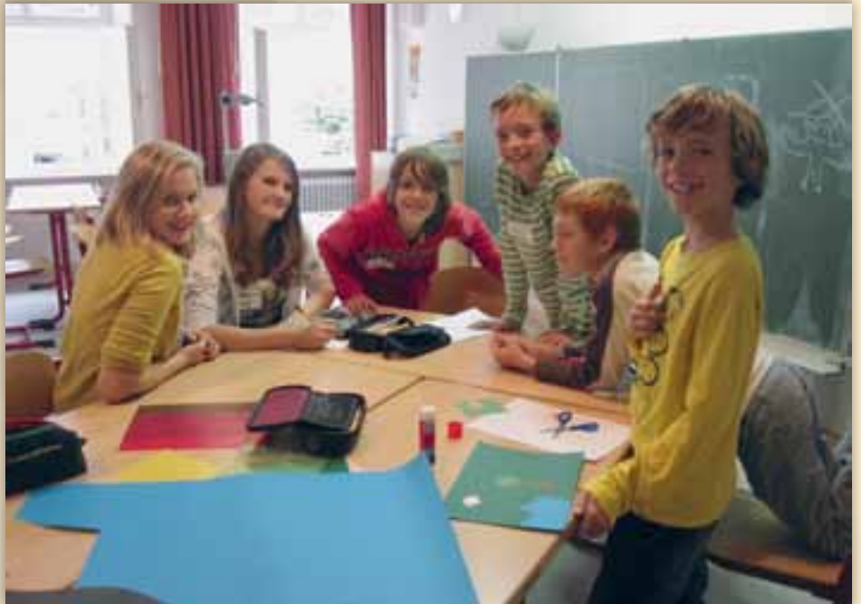
Frische Buben und Mädchen

Zum dritten Mal in Folge darf sich die Wirtschaftsschule wieder „Umweltschule in Europa“ nennen. Die Auszeichnung wurde im Rahmen einer Feierstunde vom bayerischen Umweltminister verliehen.