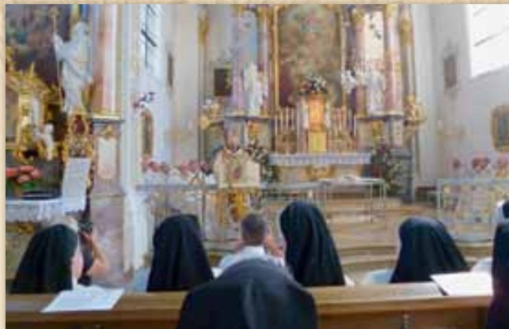
Beim Festgottesdienst in Oberschönenfeld